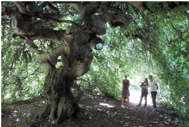
Beeindruckende Süntel-Buche an der Weser

Seit über 50 Jahren vermehren wir Süntel-Buchen. In unseren Arboreten bei Nettelrede stehen fast 200 Exemplare dieser besonderen Buchen-Variante. Dieser Bestand sichert den Generhalt in unserer Region. So haben aus unserer Nachzucht bereits viele Bäume eine neue Heimat im Deister und Süntel gefunden, und auch auf zahlreichen öffentlichen Flächen verzaubern sie die Besucher.