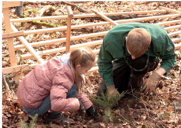
Baumpflanzungen mit der Waldjugend

Seit rund 40 Jahren unterstützen wir junge Menschen in der Umweltbildung im Wald. Zu unseren Kooperationspartnern hierbei gehören die Waldjugend und der Waldkindergarten in Bad Münde sowie Schulen. Unsere Arboreten stehen ihnen dabei als Lern- und Erlebnisort offen.