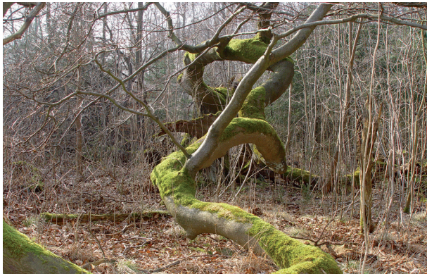
Ast einer Süntel-Buche im vereinseigenen Arboretum bei Nettelrede