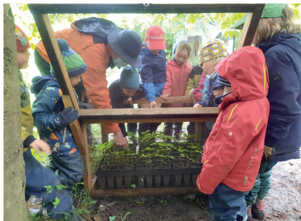
Eichenanzucht mit dem Waldkindergarten