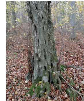
Hainbuche – Habitatbaum im Deister