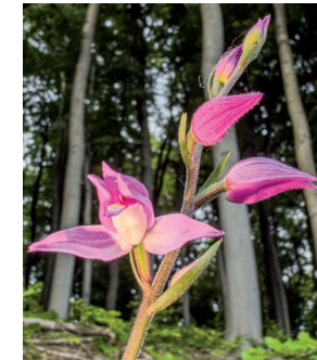
Orchidee Rotes Waldvögelein im Deister