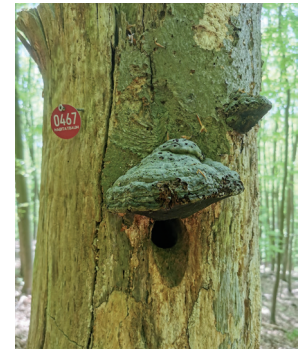
Für unser Spechtbaumprojekt haben wir schon 100 tote Bäume angekauft